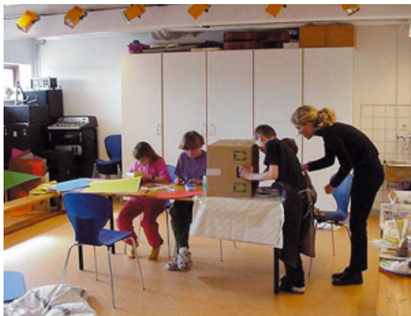
Fællesskabets mange muligheder

KFBU ønsker, at det socialpædagogiske arbejde udføres med baggrund i foreningens kristne menneskesyn, og at dette signaleres til vore samarbejdspartnere og medarbejdere. Det er derfor vigtigt at sætte fokus på dette og gøre det til et centralt område i udviklingen af vore institutioner.