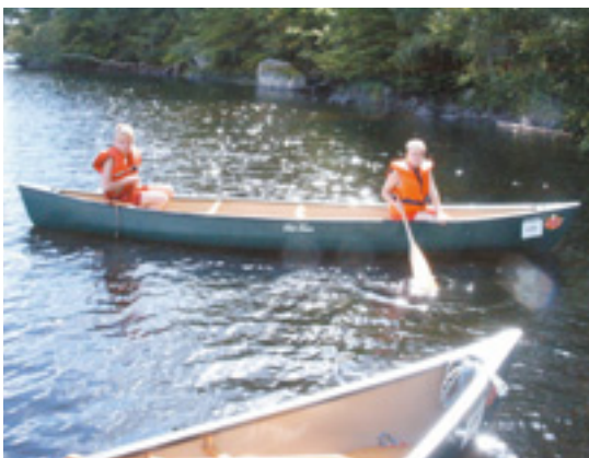
Leg, spænding og udfordringer.

Det betyder naturligvis ikke, at vores faglighed skal undervurderes, men det er vigtigt, at vi er