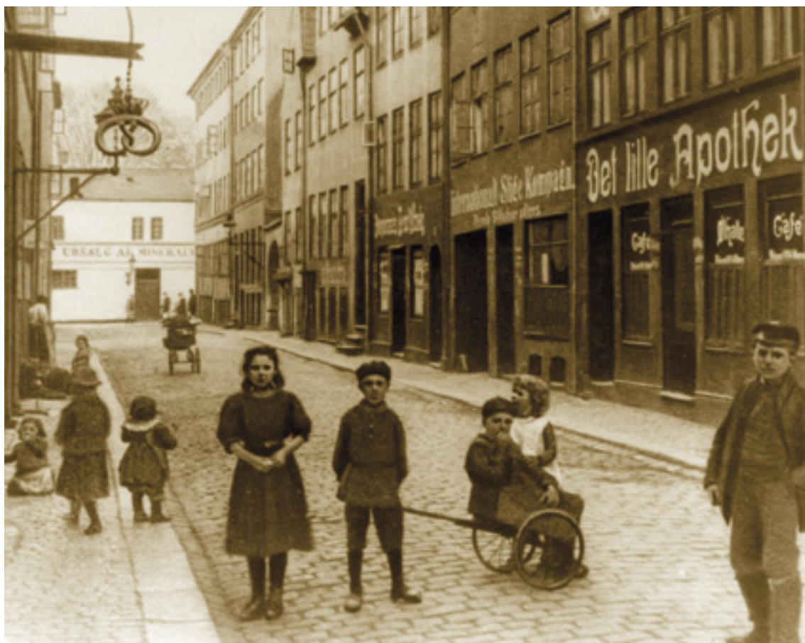
Børneliv i St. Brøndstræde anno 1908.