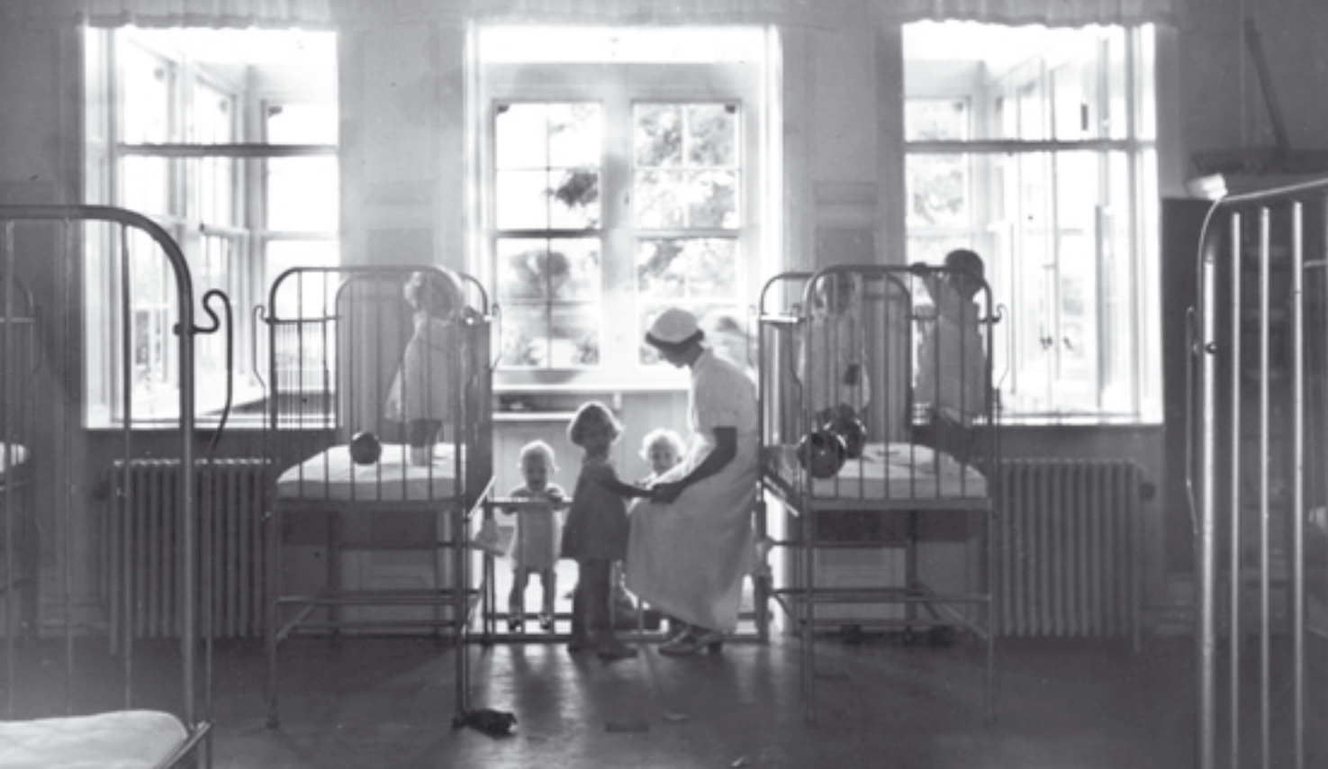
Nærvær skaber tryghed. Lykkesholm 1941.