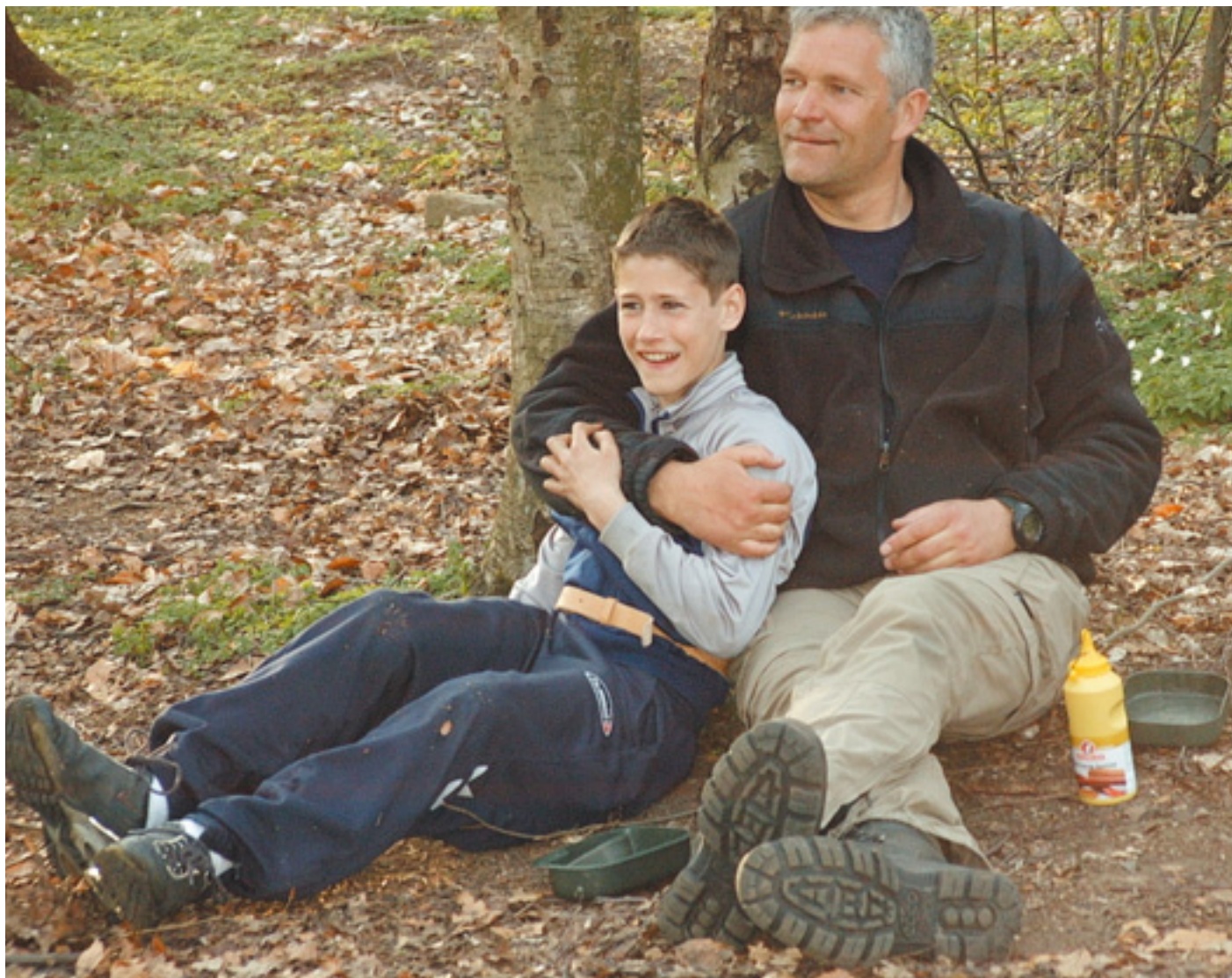
Nærhed er selvværdets byggesten. Fra en vandretur i Sverige.

KFBU ønsker at tilkendegive sine hensigter med sit arbejde – ikke blot med ord. Uden handlinger bliver selv de bedste intentioner meningsløse. KFBU ønsker, at der er sammenhæng, mellem det vi siger, og det vi gør, og det må naturligvis få konsekvenser for den måde, vi omsætter vore hensigtserklæringer på i forholdet til vores medmennesker – altså de børn, unge og familier, vi har kontakt med. På denne måde bliver vores særkende tydeligt.