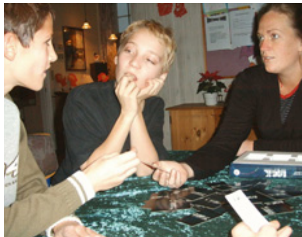
Hjemmets varme og tryghed.

bevidste om, på hvilken måde og i hvilket omfang vi er henholdsvis forældre og pædagoger i vores samspil med børnene og de unge.