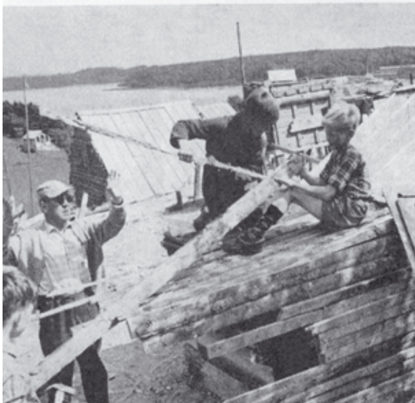
Aktivitet på skrammellegepladsen, Hostruphøj, 1964.