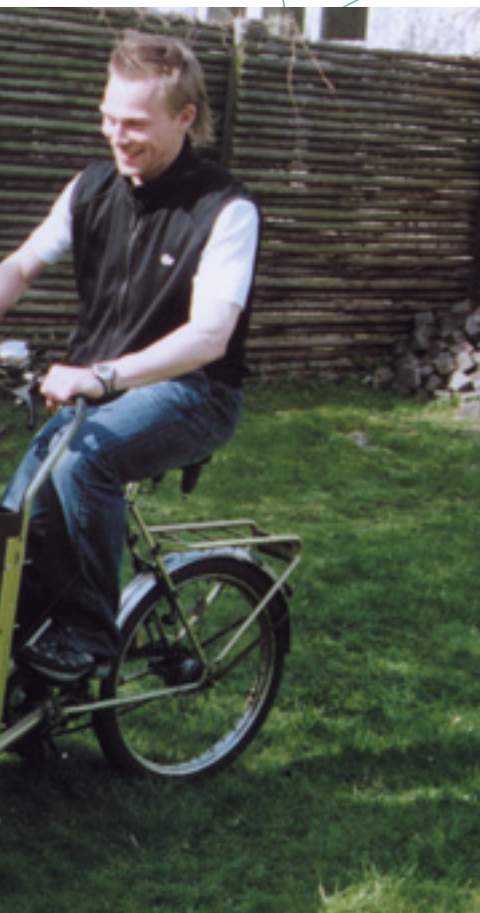
Børn i trygge rammer.