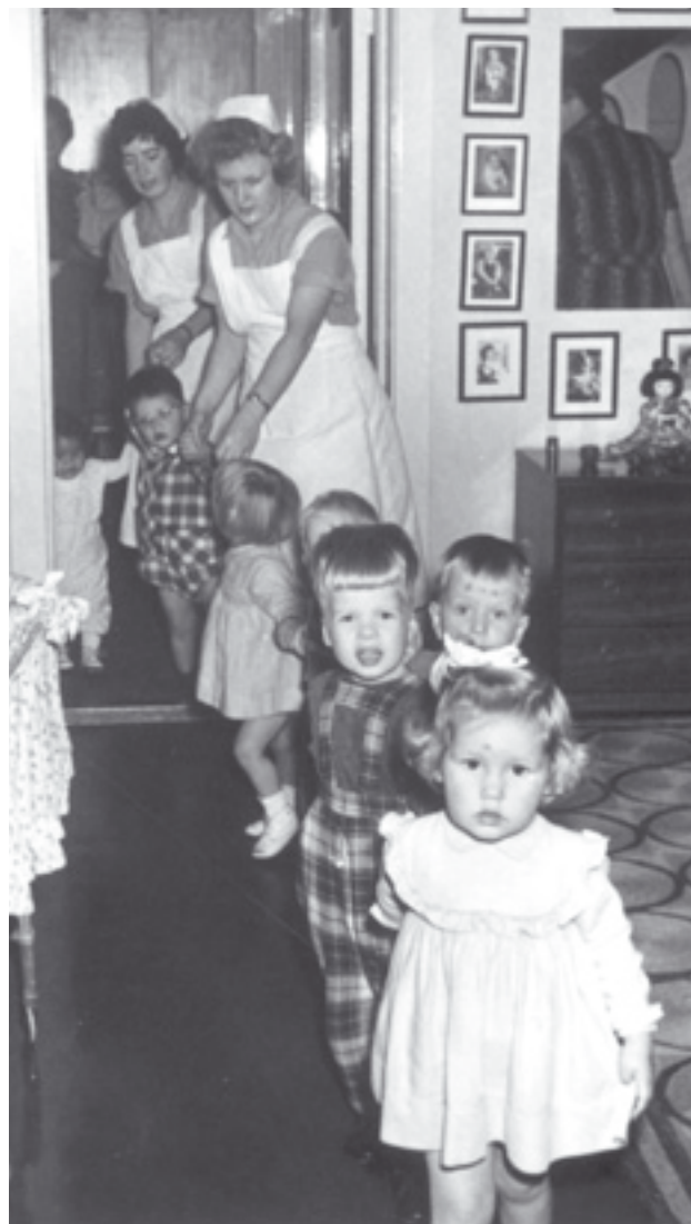
Fest på børnehjemmet Lykkesholm, 1952.